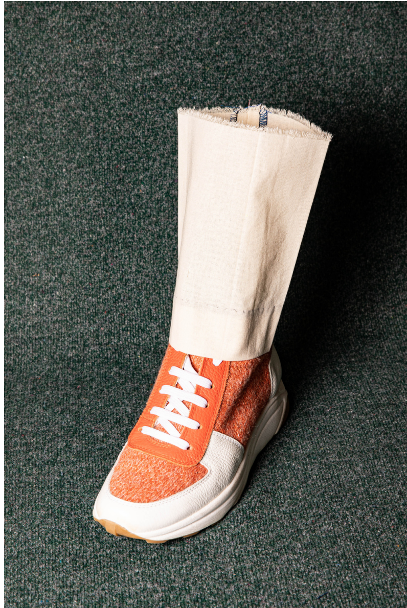
Pièce d'étude sur l'ourlet