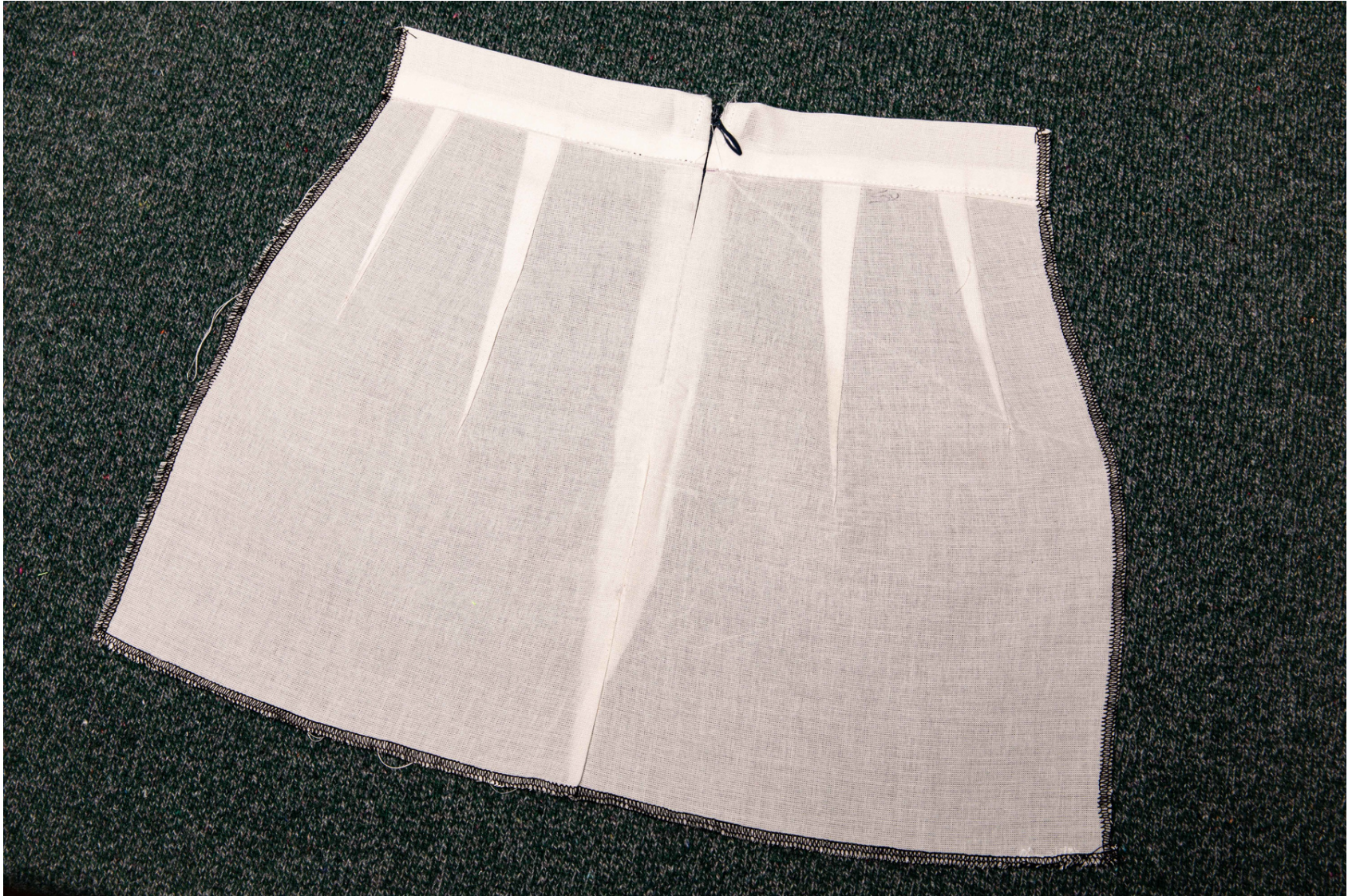
Pièce d'étude sur la fermeture à glissière invisible et les pincés