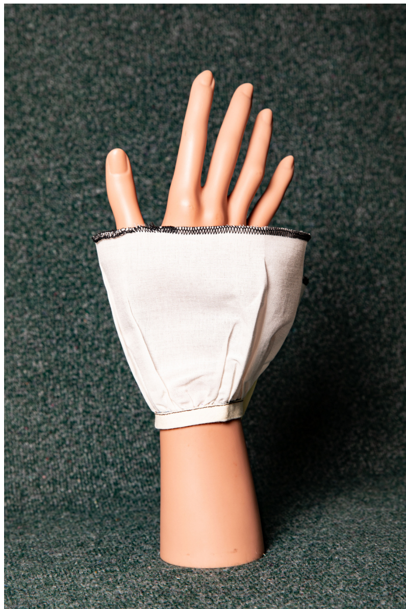
Pièce d'étude sur les fronces et le biais