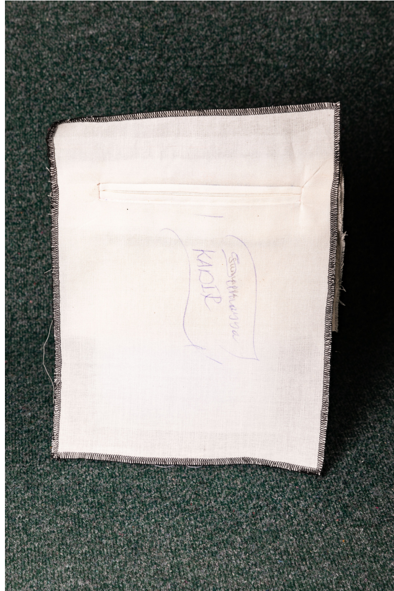
Pièce d'étude sur la poche passepoilée