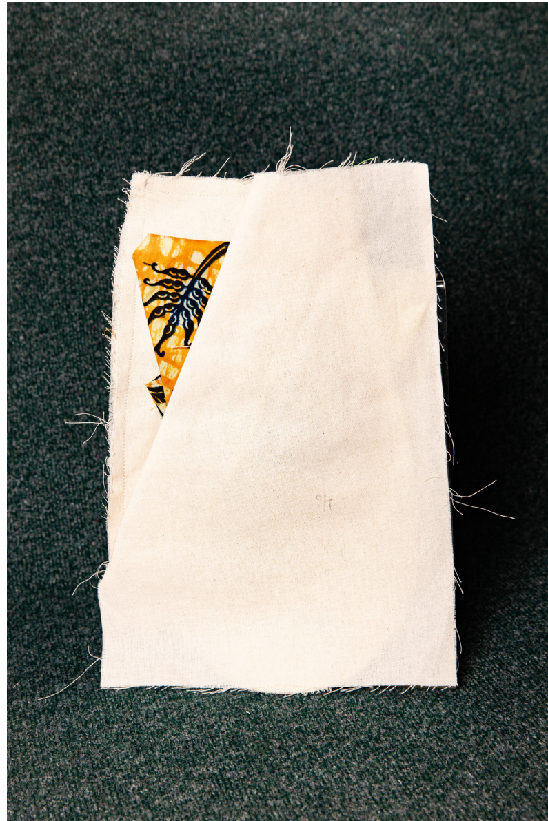
Pièce d'étude sur la poche italienne