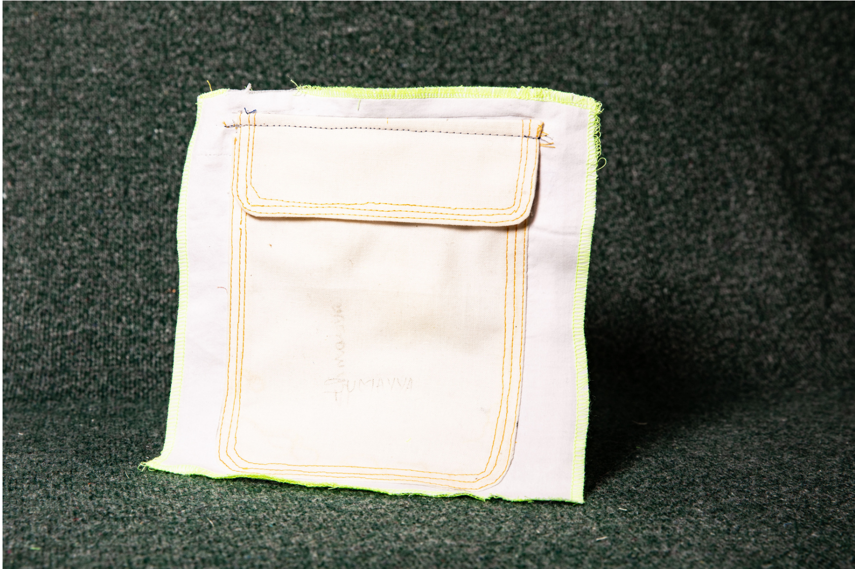
Pièce d'étude sur la poche plaquée arrondie à rabat