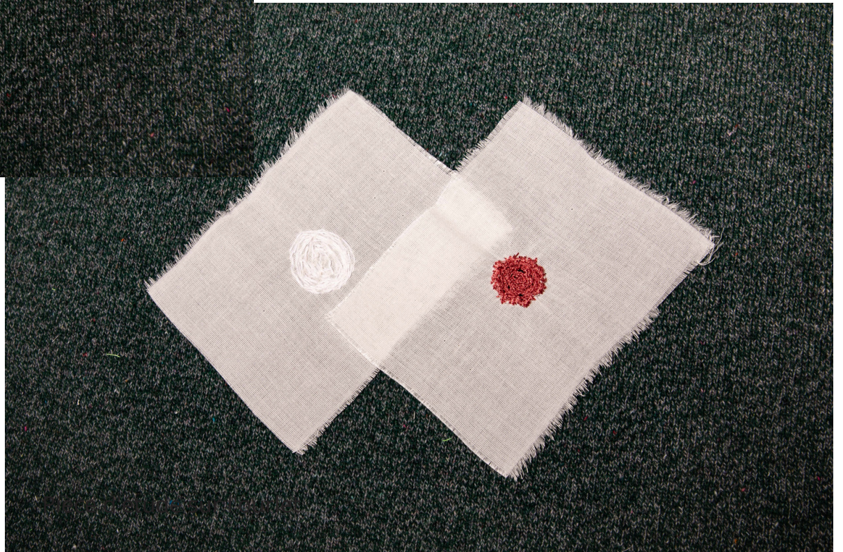
Essai de broderie sur toile