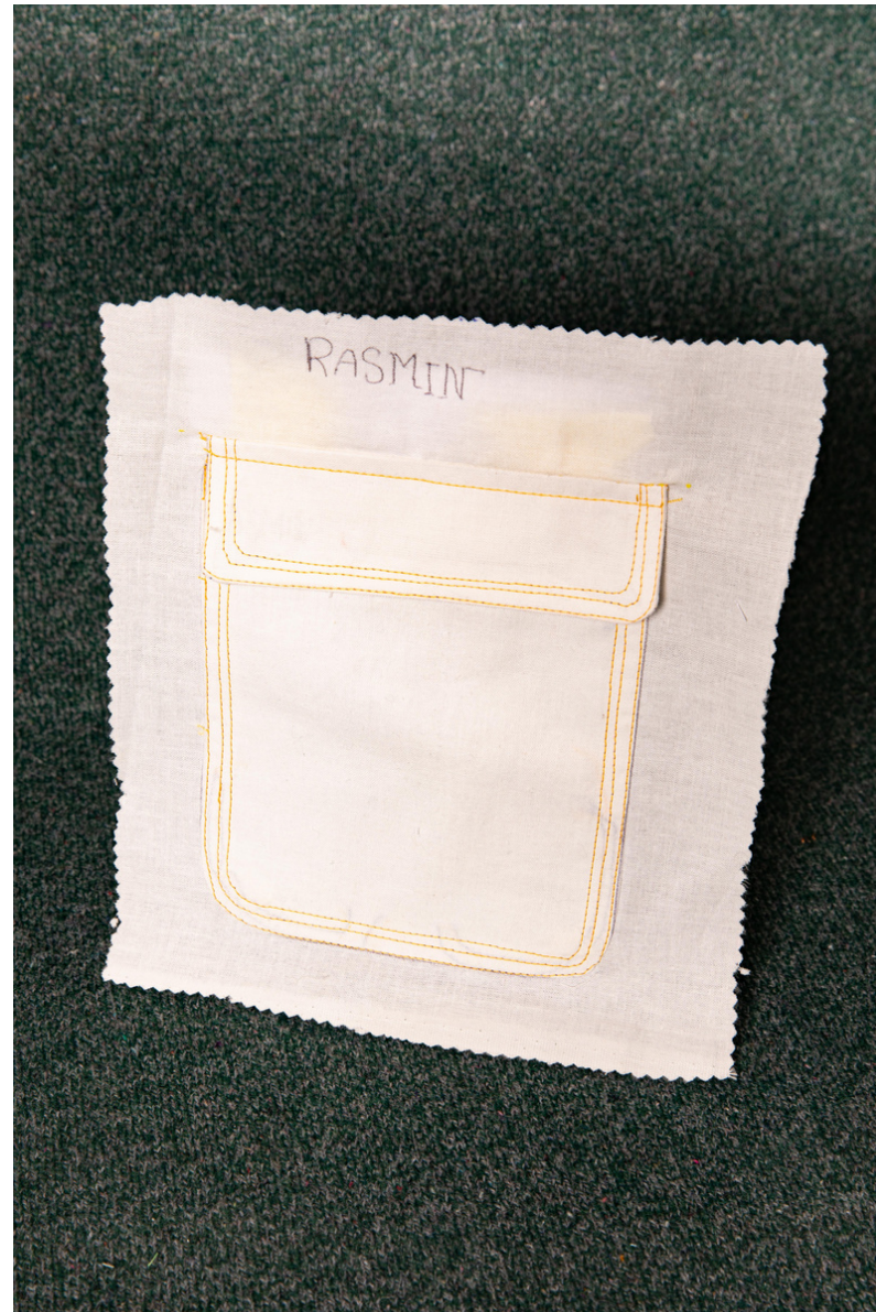
Pièce d'étude sur la poche plaquée arrondie à rabat