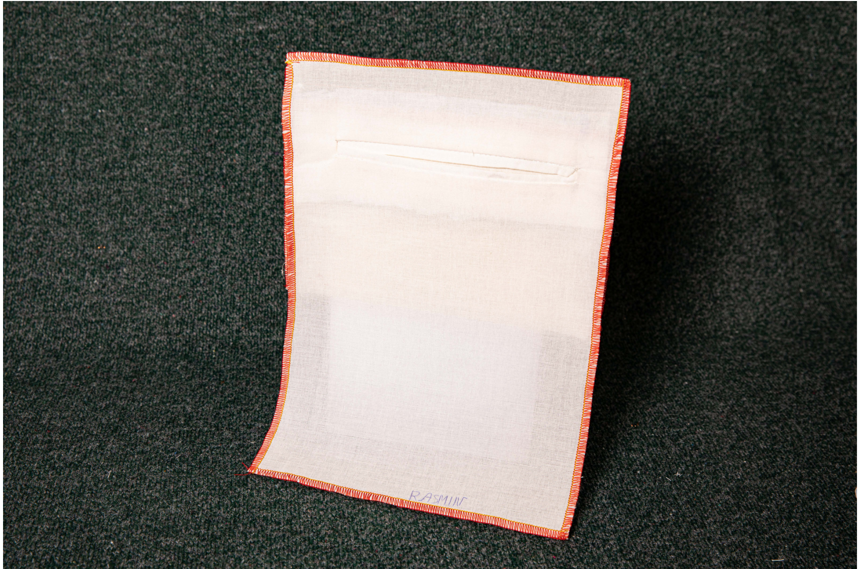
Pièce d'étude sur la poche passepoilée