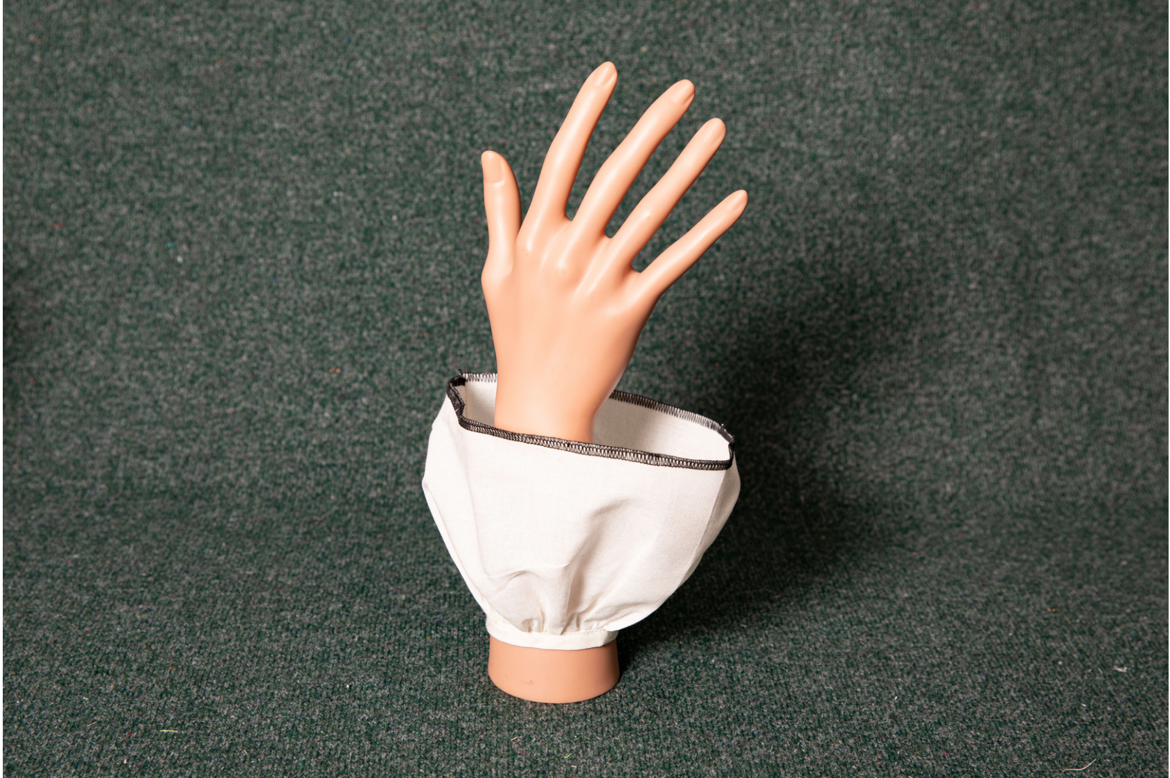
Pièce d'étude sur les fronces et le biais