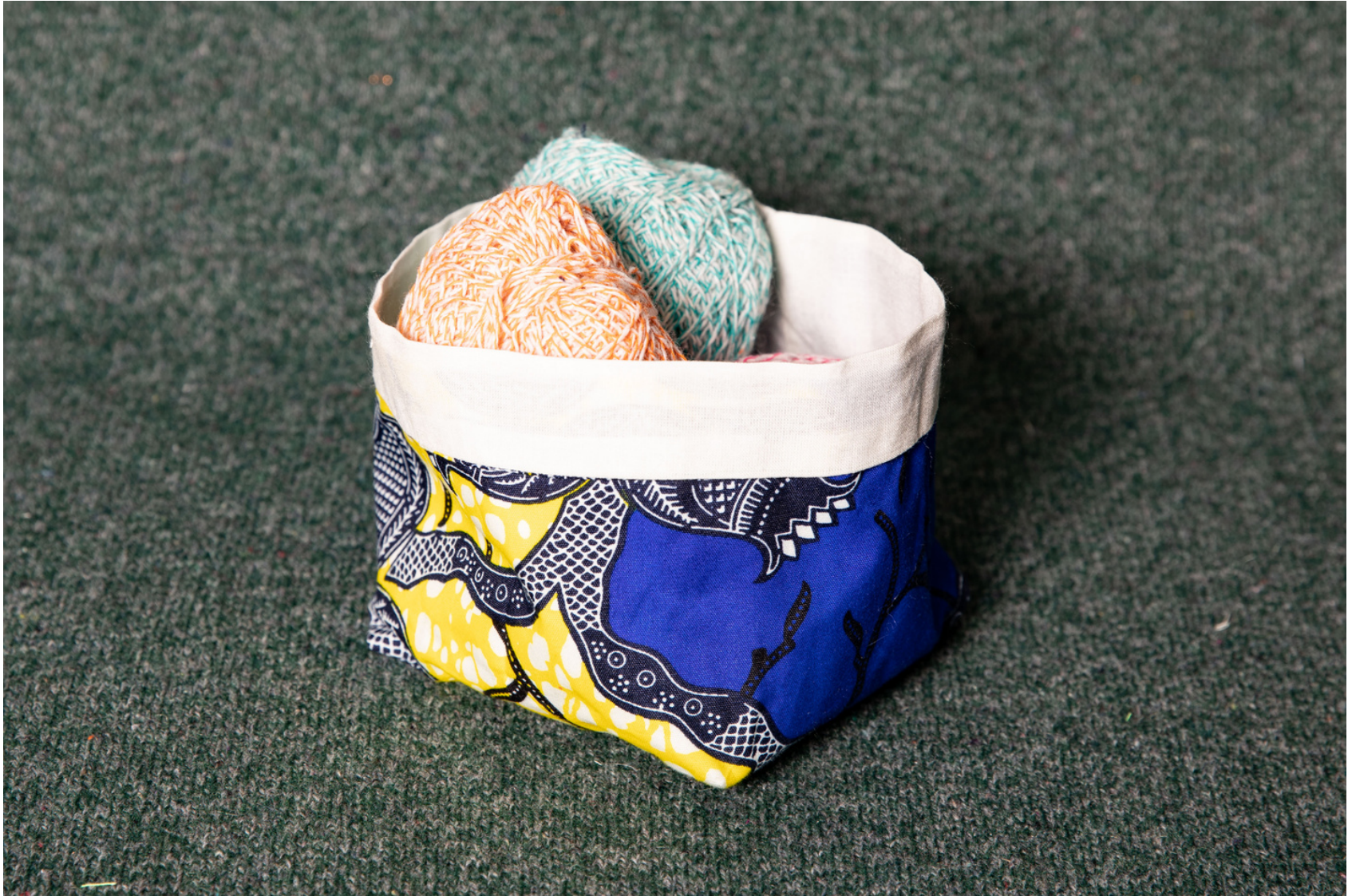
Panier en wax