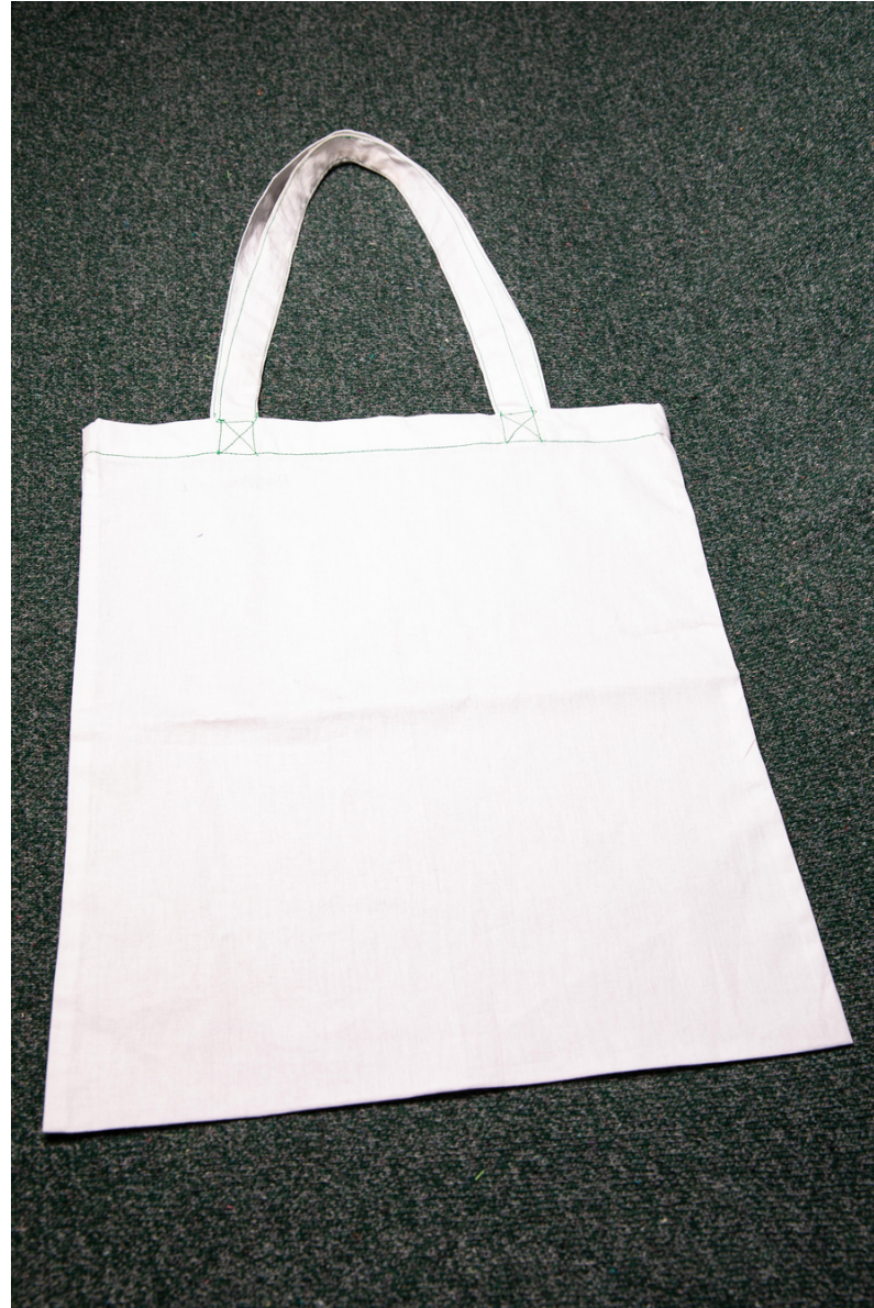
Tot bag en toile