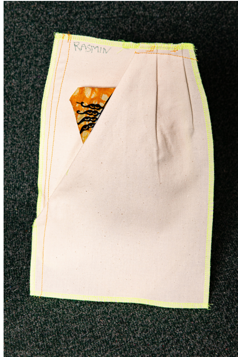
Pièce d'étude sur la poche italienne