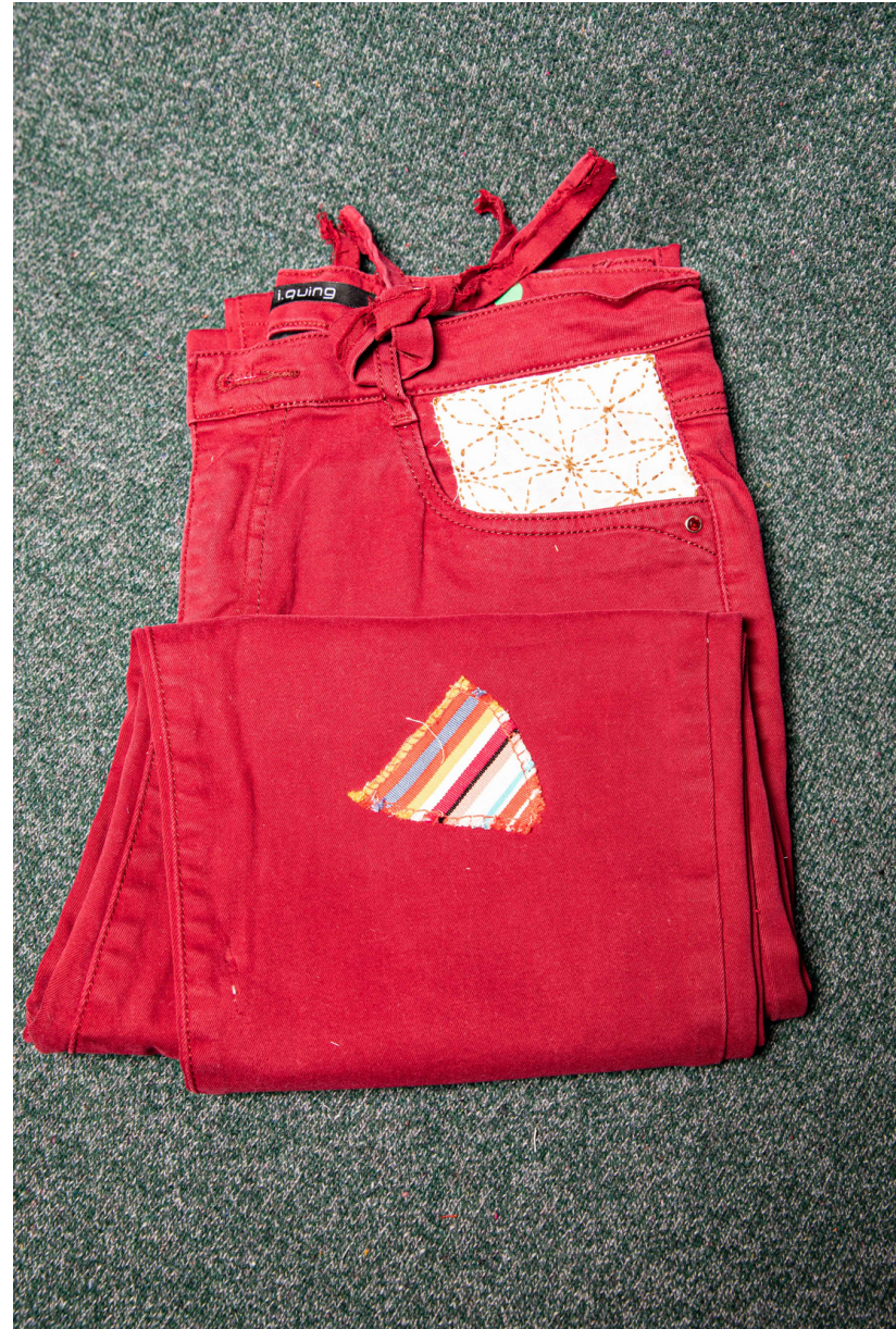
Customisation d'un jean