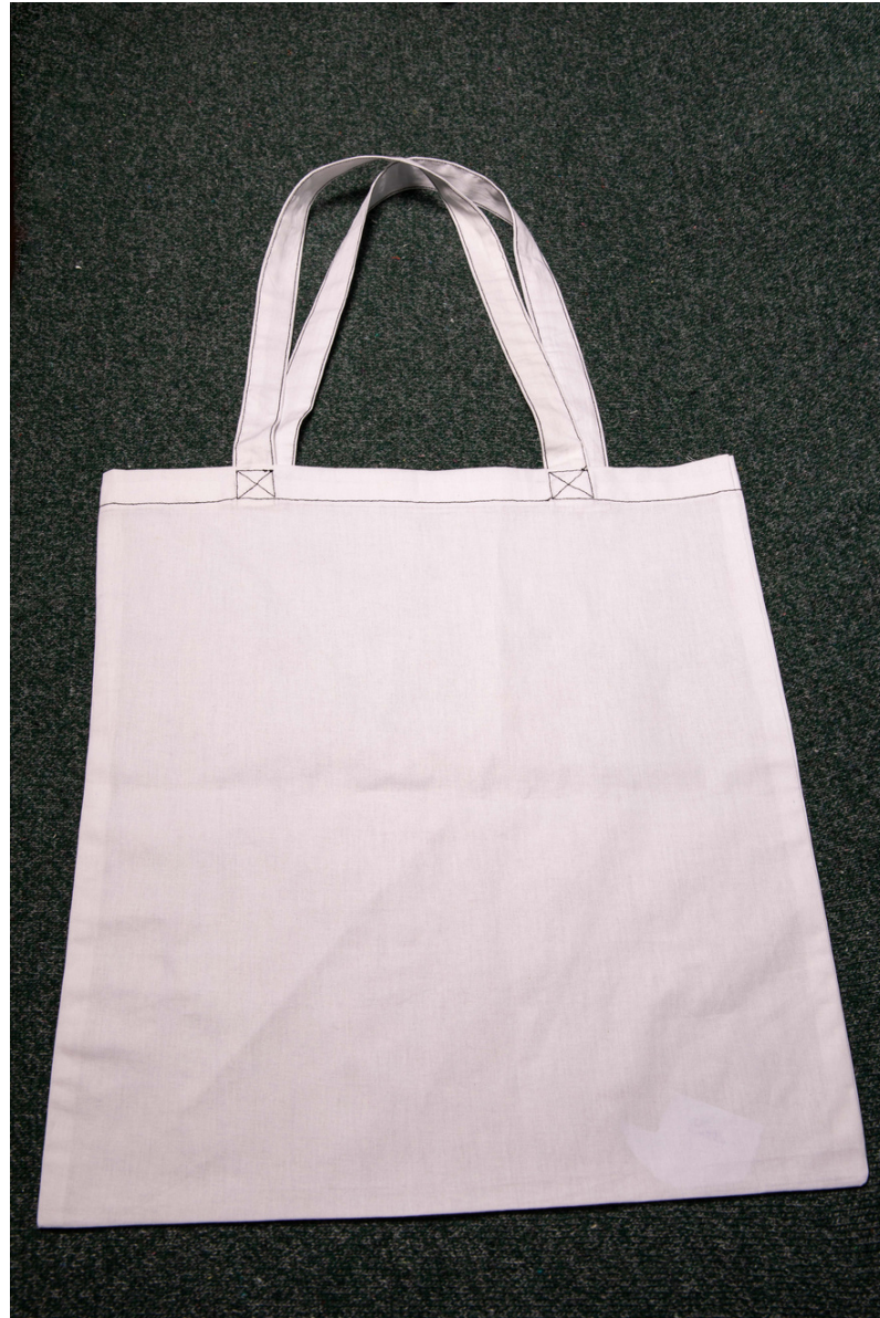
Tot bag en toile