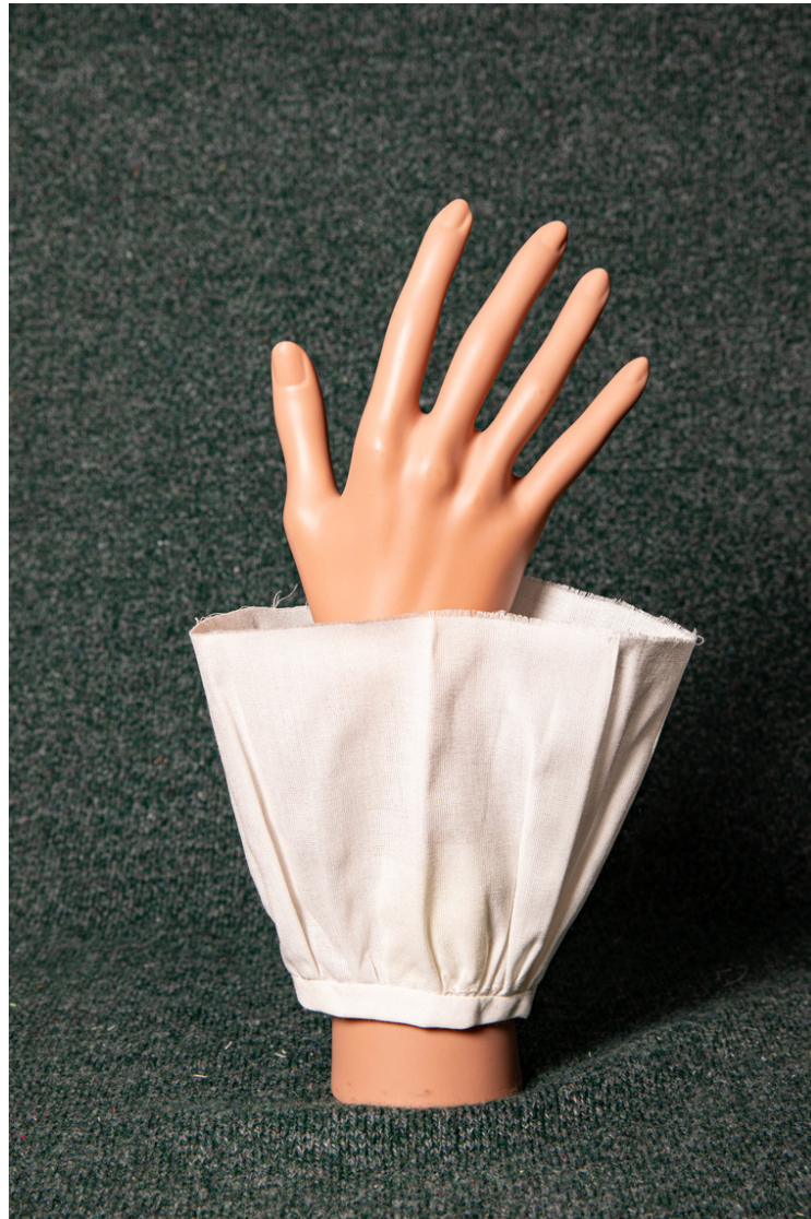
Pièce d'études sur les fronces et le biais