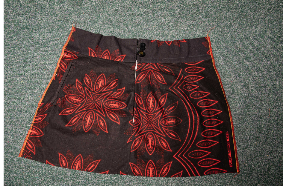
Pièce d'études sur les pincés et la fermeture à glissière invisible